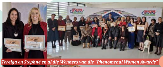
Terelga en Stephné en al die Wenners van die “Phenomenal Women Awards”