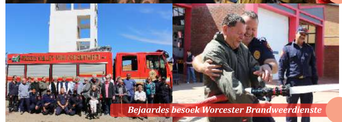
Bejaardes besoek Worcester Brandweerdienste