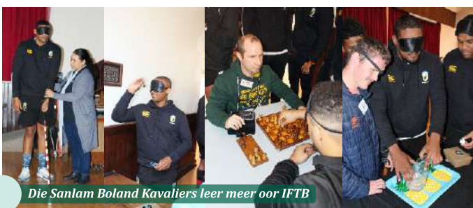
Die Sanlam Boland Kavaliers leer meer oor IFTB