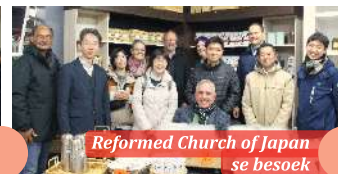
Reformed Church of Japan se besoek