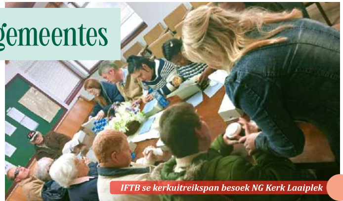
IFTB se kerkitreikspan besoek NG Kerk Laaiplek