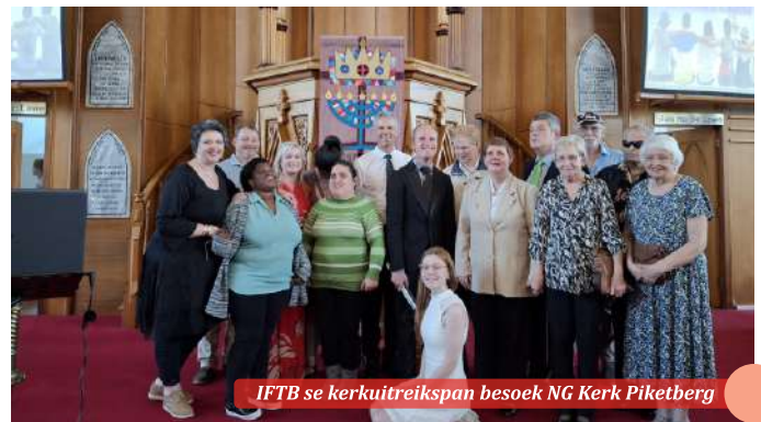
IFTB se kerkitreikspan besoek NG Kerk Piketberg