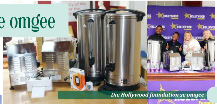
Die Hollywood foundation se omgee

Die Hollywood Foundation het ons geseën met 'n baie waardevolle skenking van "urns" en bloeddrukmeters. Ons wil graag baie dankie sê vir hierdie groot skenking.