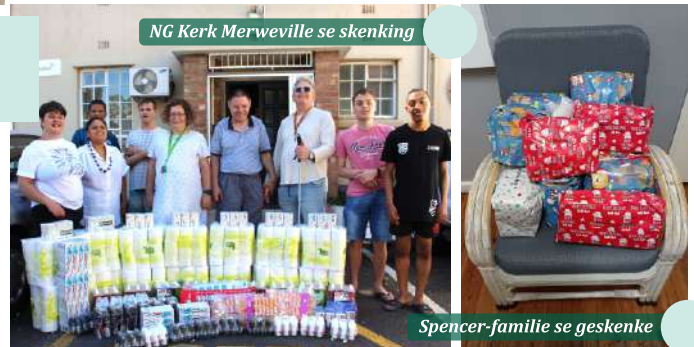
NG Kerk Merweville se skenking

Ons wil uit die diepte van ons hart baie dankie sê aan elke persoon, gemeente en besigheid wat ons inwoners se lewens verryk het in Kerstyd. 'n Groot dankie aan die volgende donateursvriende: NG Kerk Merweville vir die skenking van toiletware, die Spencer-familie vir die spesiaalverpakte