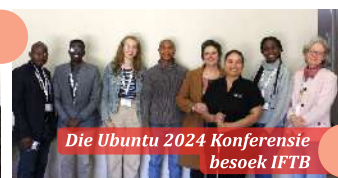
Die Ubuntu 2024 Konferensie besoek IFTB