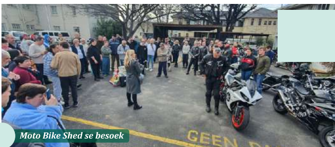
Moto Bike Shed se besoek

Indien u graag vir ons wil kom besoek of ons wil mooi om by u kerk, instansie of afreeoord te kom kuier, kontak ons gerus by 023 347 2745 of stuur 'n e-pos na reception@innovationfortheblind.org