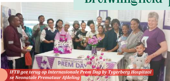
IFTB gee terug op Internasionale Prem Dag by Tygerberg Hospitaal se Neonatale Prematuur Afdeling

Ons Breiwillegheid-projek het altesaam 100 gehekelde seekat- en mussiepakkes by Tygerberg Hospitaal se neonatale prematuurafdeling afgegee. Ons wil dankie sê aan elke persoon wat wol geskenk het vir die projek. Jul donasies maak dit moontlik vir ons om die warmte van liefde weer met ander te deel.