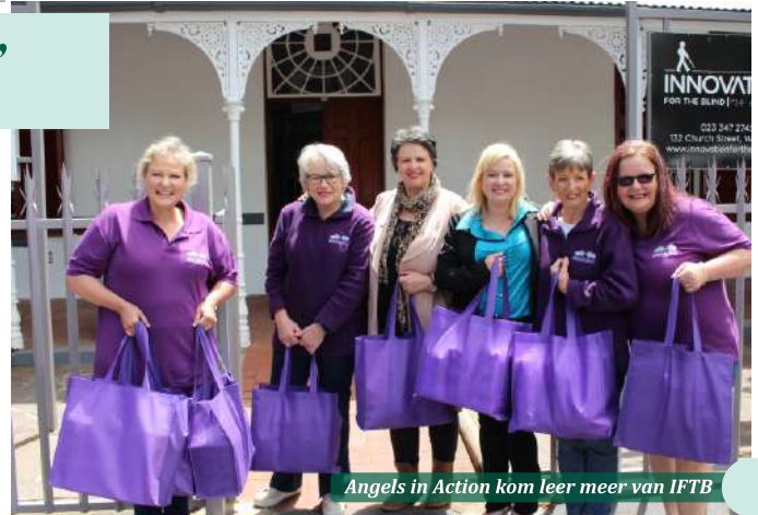
Angels in Action kom leer meer van IFTB

Ons het die voorreg gehad om op 29 Oktober vier "angels" van Angels in Action te verwelkom om meer te leer oor ons organisasie. Hulle het die geleentheid gehad om die leefwêreld van die siggestremde te betree en te leer hoe ons inwoners uitdagings trotseer. Aan die einde van die besoek het hulle ons inwoners geseën met sakke vol liefde en omgee in die vorm van toiletware.