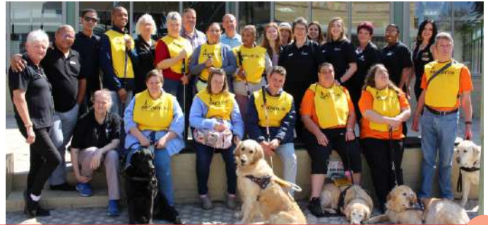
Deelnemers aan die Mall Walk in die Worcester Mountain Mill Shopping Centre