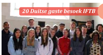
20 Duitse gaste besoek IFTB