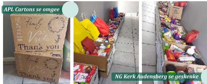
APL Cartons se omgee

geskenke vir ons gesinne se kinders, APL Cartons vir twee groot bokse vol kruideniersware en dan ook NG Kerk Audensberg vir bokse gevul met kruideniersware, toiletware en geskenke vir ons gesinne. Jul skenkings maak die feesseisoen spesiaal vir al die gesinne in ons sorg.