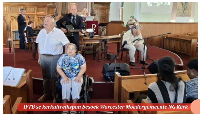
IFTB se kerkitreikspan besoek Worcester Moedergemeente NG Kerk