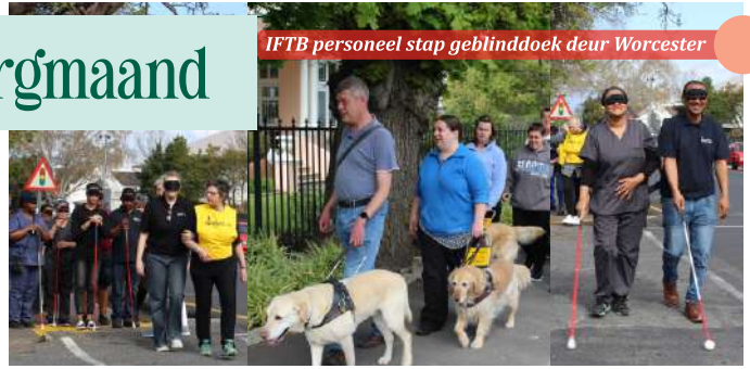
IFTB personeel stap geblinddoek deur Worcester

Hiermee tesame het ons ook weklíks wenke op ons sosiale media geplaas. Verskeie oogkundiges in Worcester het deur die maand gratis siftingstoetse aangebied. Ons waardeer julle betrokkenheid in hierdie maand van bewusmaking.